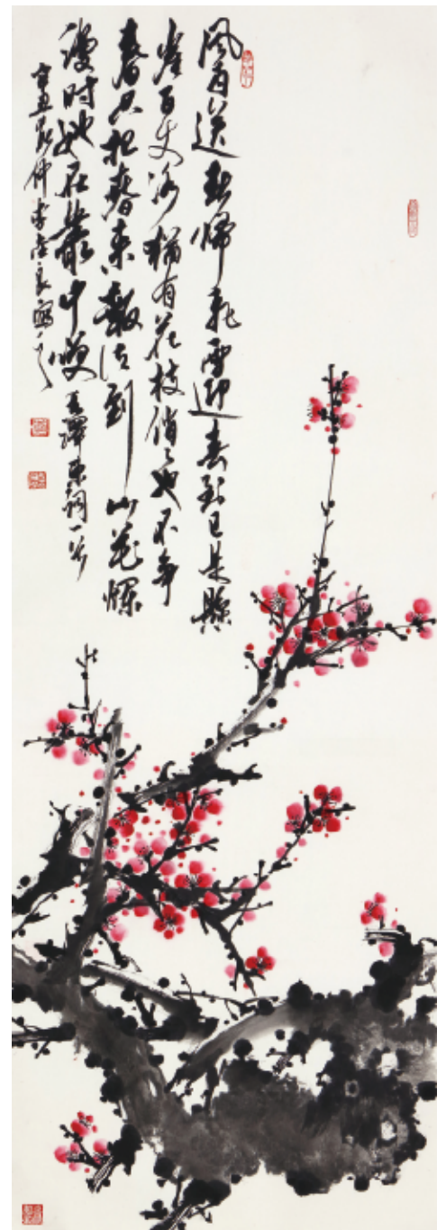
▲ 李金良 《毛泽东词意》