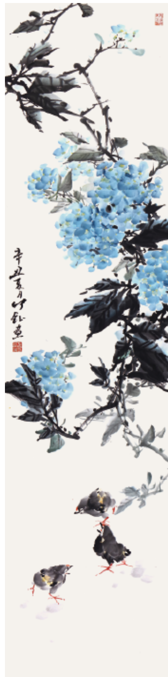
▲ 何钰 《绣球雏禽》