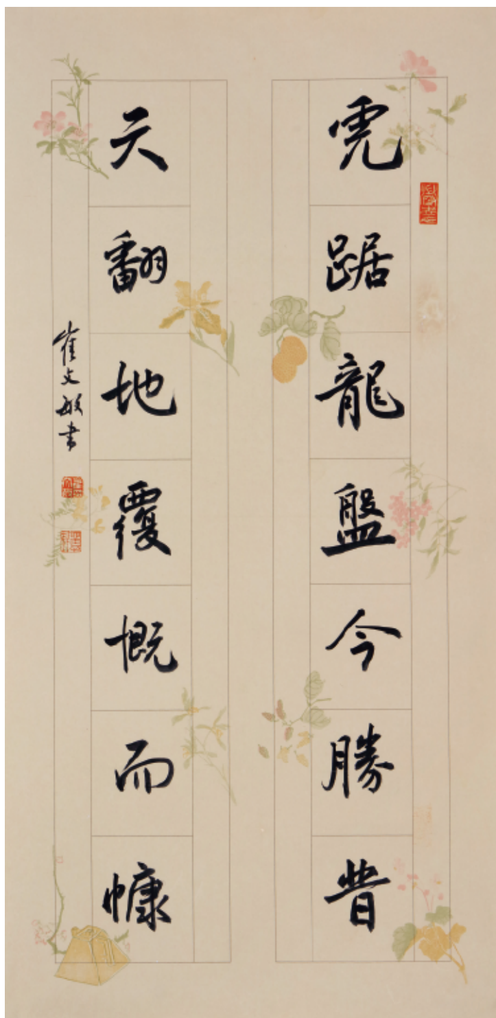
▲ 崔文敏 《虎踞天翻联》