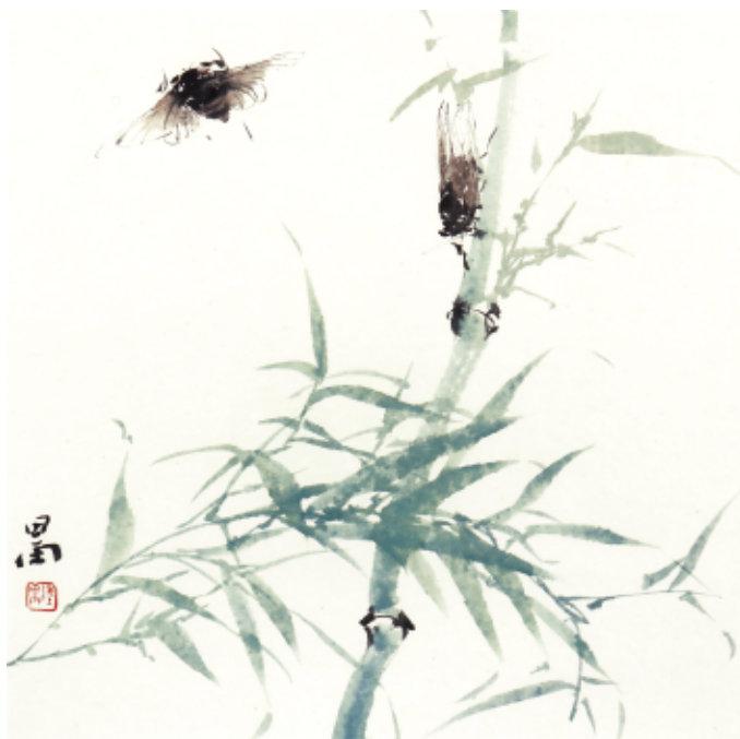
▲ 陆迅 《清声》