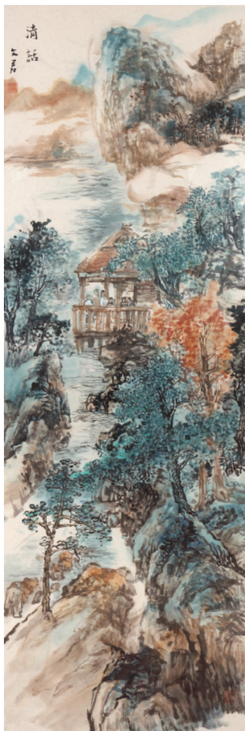
▲ 李文君 《清话》