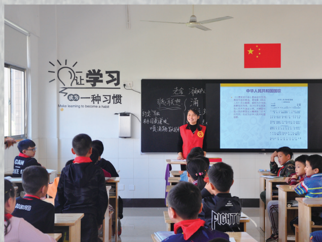
担任法治班主任讲授法治微课堂