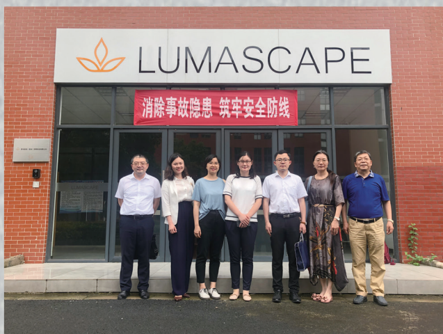
开展“四进四送”专项活动，为企业进行法治体检