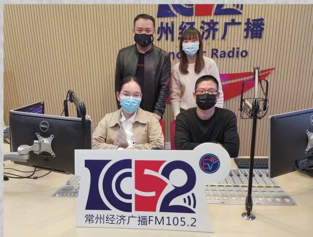
律师做客常州广播电台《生活有说法》节目，为广大听众朋友解答法律问题普及法律知识