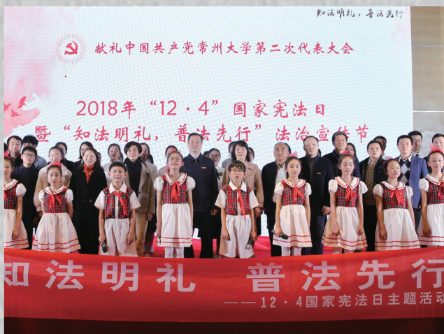
开展“知法明礼 普法先行”法治宣传节活动