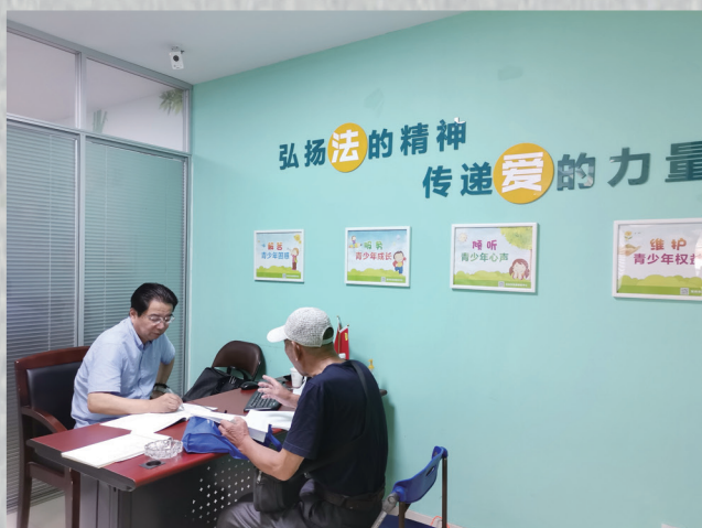
名优律师“坐堂会诊”为群众排忧解难