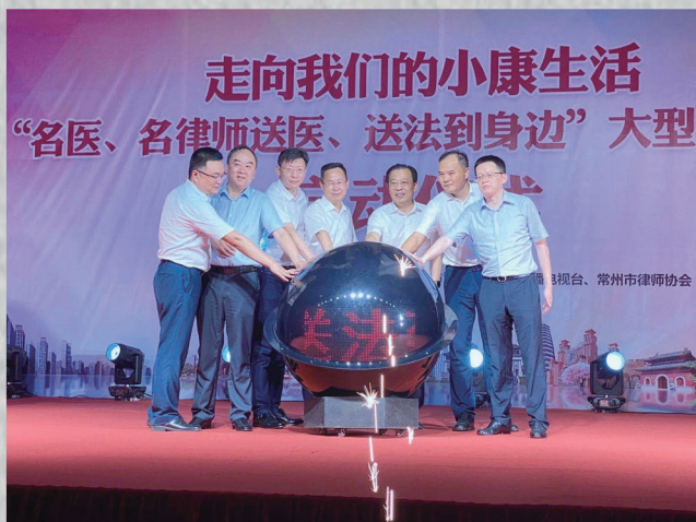
“名医、名律师送医、送法到身边”大型公益启动仪式