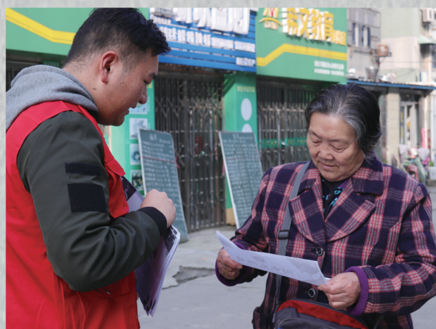
进社区、进学校开展法治宣传