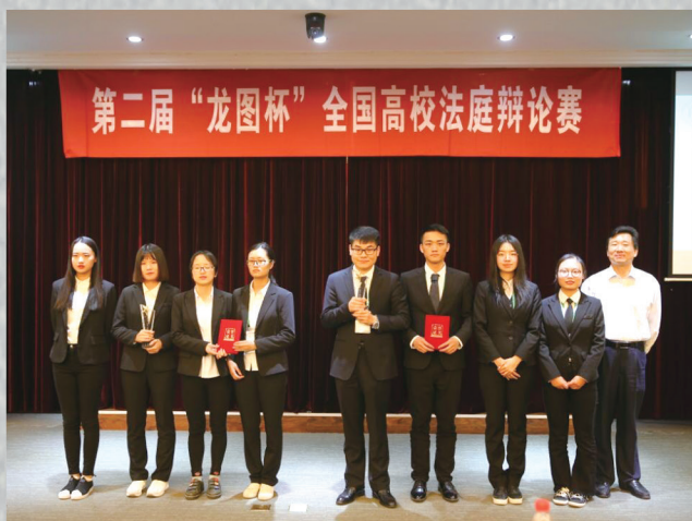
荣获第二届“龙图杯”全国高校法庭辩论赛季军