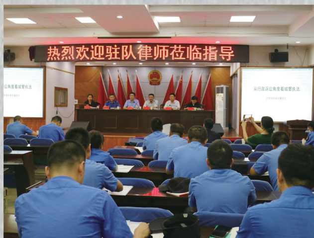
“驻队律师”项目助力基层法治再创新