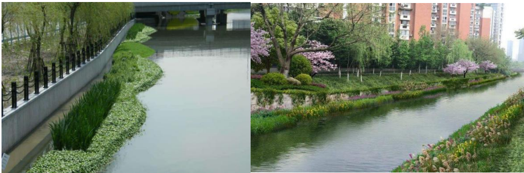
图 B.4 水生植物恢复技术示例

水生植物宜采用根系发达、根茎分蘖繁殖能力强、生长快、生物量大、不易倒伏、管理容易，具有一定景观效果和一定经济价值的植物。主要分为挺水植物、浮水植物、浮叶植物、沉水植物等。