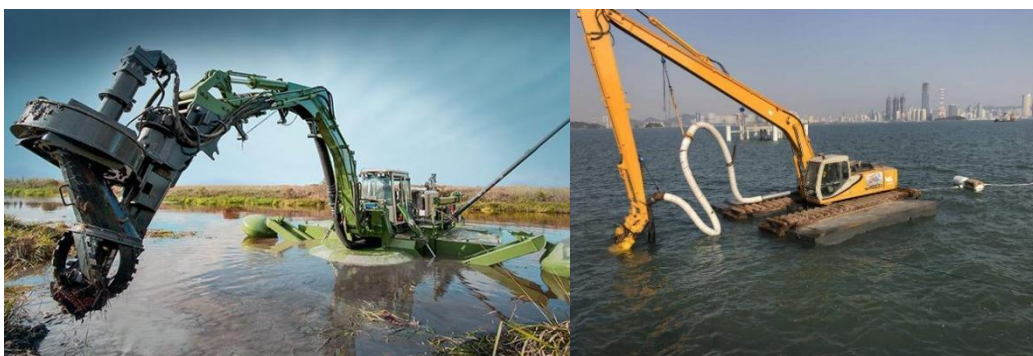
图 A.3 泵吸式清淤

泵吸式清淤：也称射吸式清淤，将水力冲挖水枪和吸泥泵同时装在 1 个圆筒状罩子里，由水枪射水将底泥搅成泥浆，通过泥浆泵将泥浆吸出，经管道输送至岸上堆场，整体机具均装备在船只上。