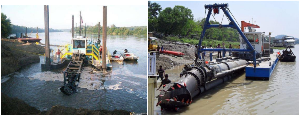
图 A.4 绞吸式清淤