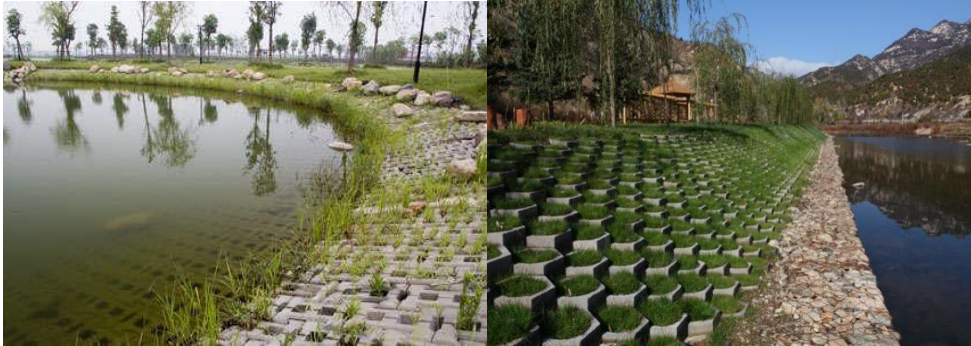
图 C.8 预制砌块（砖）防护示例

成错落有致的独特景观。主要有普通砌块（六边形）、鱼巢砖和铰接式砌块等，结构底面需铺设反滤层和垫层，一般选用土工布或碎石。具体设计可参照附录 E 图 E.5 至 E.7 生态砌块（砖）防护典型设计。