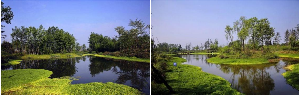
图 B. 5 人工湿地处理系统示例