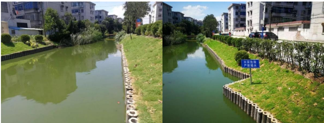
图 C. 11 密排桩防护示例

密排桩包括预应力管桩、钢筋混凝土桩、板桩、仿木桩、新材料桩、木桩等，适合水位变幅小的河道，其中木桩桩顶在水面以下，其余密排桩桩顶在常水位附近。具体设计可参照附录 E 图 E. 10 密排桩防护设计。