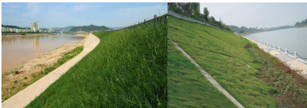
图 C.2 草皮防护示例

草皮防护是通过人工植草、铺草皮或与土工织物联合使用形成的生态防护类型。草坪植物根系与地表土壤纵横交错，紧密结合，达到固定土壤，防止水土流失的作用；草皮的遮挡能削弱暴雨的冲刷，截流雨水，减缓雨水的流速，达到减弱侵蚀土壤的效果。