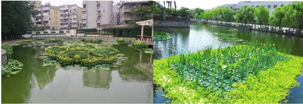
图 B.3 生态浮岛技术示例

生态浮岛采用环境友好型材料在水体中搭建水生植物种植和生长的平台。主要作用为水质净化、创造生境、改善景观等。浮岛植物以挺水植物为主，也可利用浮床种植沉水植物。