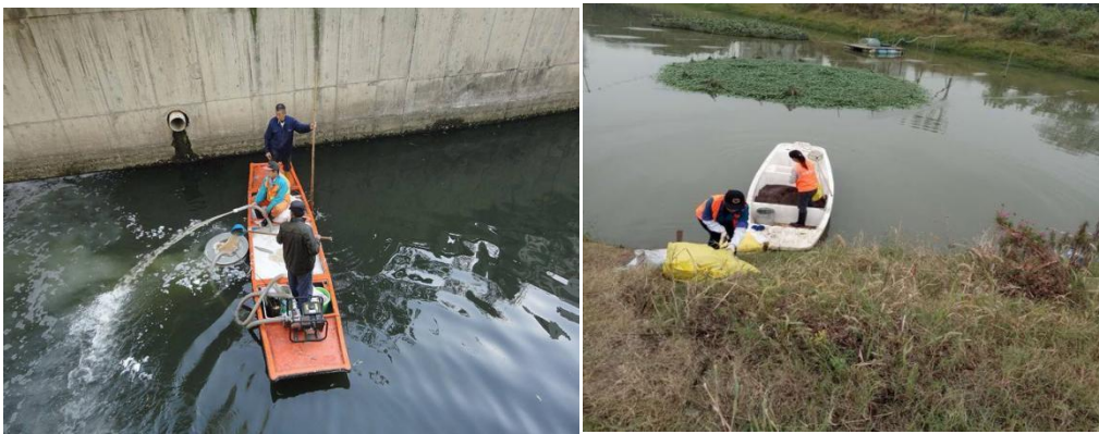
图 B. 6 微生物菌剂示例

微生物菌剂具有降解沉积物和水体中有机质、氨氮的作用。主要应用在流速较慢（断头河）、底质污染较重的、不适合疏浚的河浜。