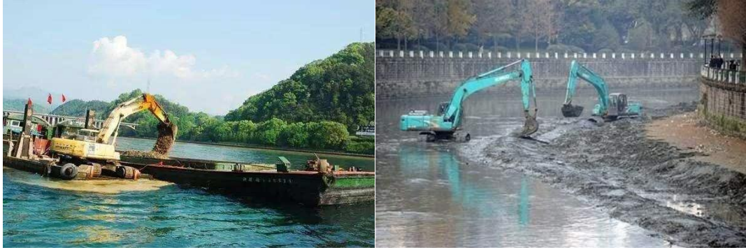
图 B.8 河道清淤示例

河道清淤主要目的为清除污染水体的内源，减少底泥污染物向水体的释放，恢复沉积物和水体的生态功能，使其适宜水生植物的恢复。疏浚的工程措施主要包括干河清淤和水下清淤等施工工艺。