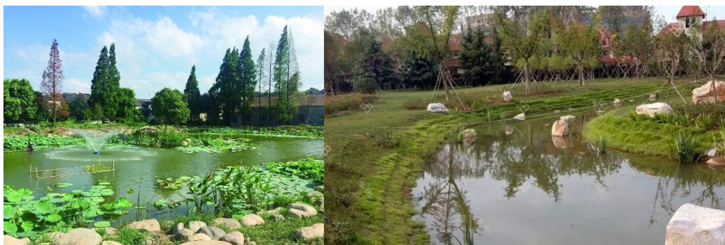
图 C.4 水生-陆生植物复合防护示例

水生-陆生植物复合型防护是指水生和陆生植物通过其根、茎、叶形成对水流的消能作用和对岸坡的保护作用的防护类型。该类型防护可以沿岸线形成一个保护性的河岸带，促进泥沙的沉淀，从而减少水流中的挟沙量；可以直接截留吸收水体中的氮、磷等营养物质，防止水体富营养化；可以为其他水生生物提供栖息的场所。