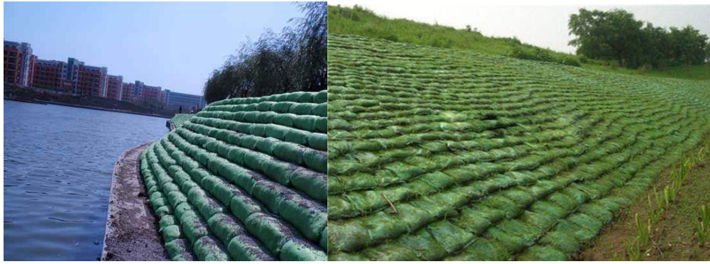
图 C. 10 生态袋防护示例