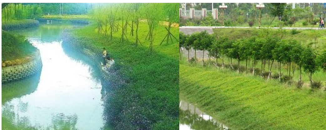
图 C.3 树木-草皮复合防护示例

树木防护是指通过在岸边栽植乔灌木树种，起到稳定、保护边坡和生态系统的生态防护；主要防护树种有柳树、水杉等，一般与草皮搭配，形成树木-草皮复合型防护。