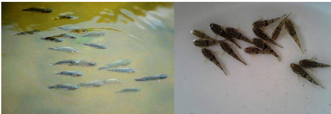
图 B. 7 水生动物投放示例

水生动物投放主要包括浮游动物、底栖动物、鱼类等的投放。应根据河道的情况因地制宜地进行。