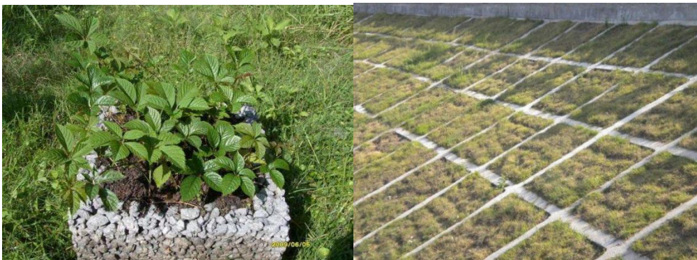
图 C.9 植生混凝土防护示例

植生混凝土亦称生态混凝土、绿色混凝土，是通过材料筛选，采用特殊工艺制造出来的具有特殊结构与表面特性、能够适应绿色植物生长的混凝土，具有保护环境、改善生态条件、保持抗冲刷性能、净化水环境的功能。主要由多孔混凝土、保水材料、难溶性肥料和表层土组成。一般要求混凝土孔隙率达到 18%~30%，孔隙尺寸大，孔隙连通。具体设计可参照附录 E 图 E.8 植生混凝土防护典型设计。