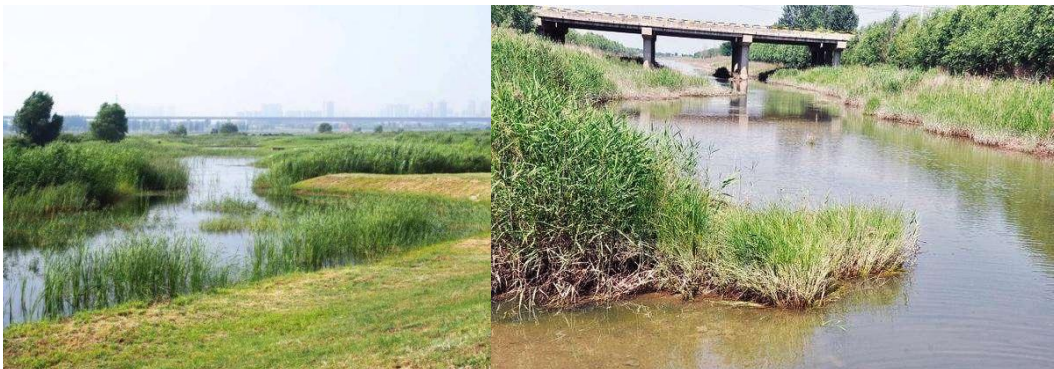
图 C.1 自然植被防护示例

农村河道部分农业区河道（岸），地质基础条件较好，景观功能弱化，可以依据现状的岸线特征做简单的植被、岸坡的整治，保持大多原有的生态岸线特征。具体设计可参照附录 E 图 E.1 自然植被防护。