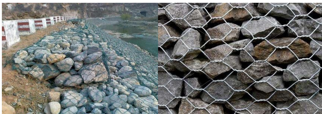
图 C.7 石笼防护示例

格宾挡墙（石笼）技术是利用铅丝、镀锌铁丝作成网笼，内装坚硬、未风化的石块，石块粒径应大于石笼的网孔。石笼一般制成圆柱体、方形或箱形。石笼抗冲刷能力强，柔韧性好；透水性好，有利于动植物生长栖息；施工方便，结实耐用，使用寿命长；可与种植土、肥料组成复合种植基，绿化景观效果好。具体设计可参照附录 E 图 E.3 和图 E.12 格宾挡墙（石笼）防护典型设计。