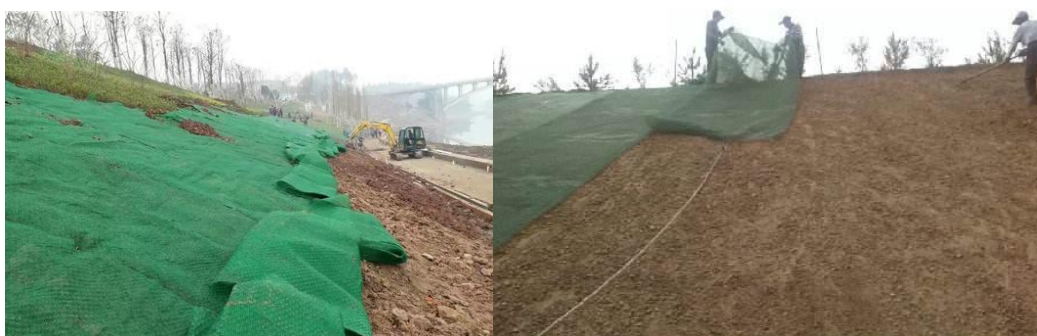
图 C.5 土工网-植被复合防护示例

土工网垫防护技术(或称草皮加筋技术)是在土质边坡上铺一层三维立体网(高强土工塑料)并固定,然后种植草籽或铺设草皮,在播种初期,可以起到防止冲刷、保持土壤以利草籽发芽、生长的作用。当植被生长茂盛后,高强土工网使草更均匀、紧密地生长在一起,形成牢固的网、草、土整体铺盖,对坡面起到浅层加筋的作用,从而防止坡面被暴雨冲刷并阻止坡面表层土体滑动。该技术能够承受 4 m/s 以上水流冲刷,在一定条件下可替代浆砌或干砌石防护。具体设计可参照附录 E 图 E.2 土工网垫防护。