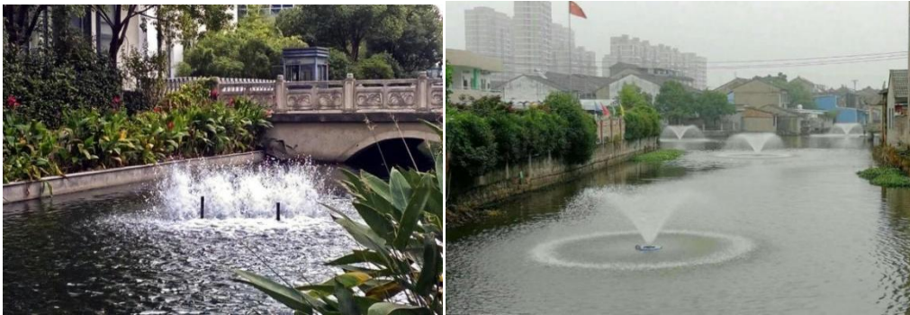
图 B.1 增氧曝气技术示例

增氧曝气是指为改善河道水体和沉积物表面的氧化还原条件，增加溶解氧的含量，消减污染物质，利用曝气机在水中曝气的技术。曝气形式可分为鼓风曝气、射流曝气、喷水式曝气等形式。主要设备包括推流式增氧机、射流式增氧机、喷水式增氧机、叶轮式增氧机、水车式增氧机、鼓风曝气机、太阳能增氧机等。