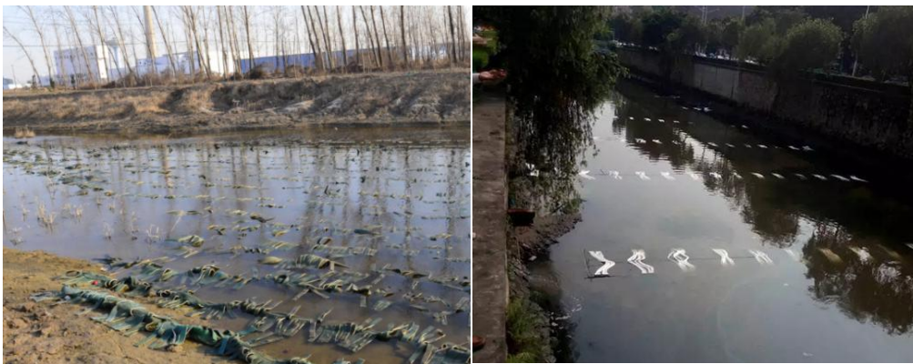
图 B.2 人工强化生物膜技术示例

人工强化生物膜是以人工载体材料作为微生物生长基质，通过微生物的附着生长繁殖来削减水体中的污染物。人工强化生物膜的人工载体宜采用多孔、比表面积大、具有立体结构高分子材料，常用的生物膜载体材料包括阿克曼生态基、碳素纤维、柔性填料、组合填料等。