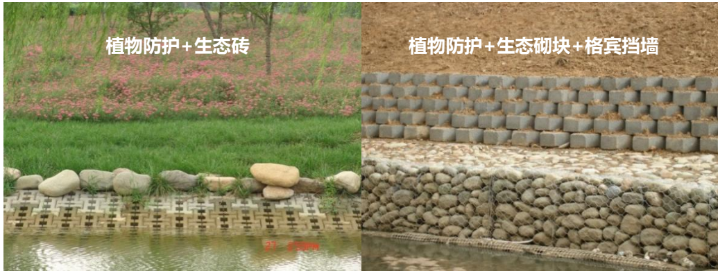
图 C. 12 组合式防护示例