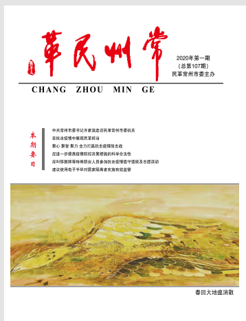
封面图片：《春回大地瘟消散》 秦杰