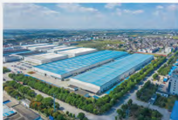
■ 常州宏发纵横新材料科技股份有限公司

常州宏发纵横新材料科技股份有限公司成立于1984年，专注于高性能纤维复合材料制造与应用技术开发，拥有38年的智能装备制造经验，以及24年的轻量化新材料研发应用历史。经过多年的技术和市场积累，形成了涵盖“原丝-碳丝-织物-复材-配套装备-检测测试-下游应用”的完整产业链，建设聚丙烯腈原丝产能3.6万吨/年、大丝束碳纤维产能1.8万吨/年。建立了以常州为中心，覆盖湖南株洲、美国艾尔帕索、北非摩洛哥的4大生产基地，产品广泛应用于风电叶片、轨道交通、航空航天、新能源汽车等领域，在全国乃至全球都处于领先地位。