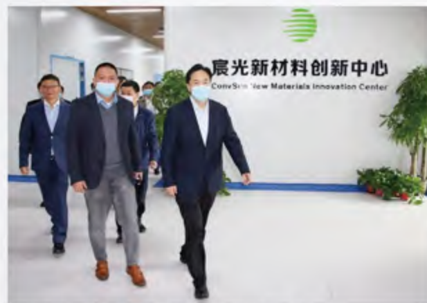
■ 调研震光（常州）新材料科技有限公司

党的二十大报告指出：必须坚持科技是第一生产力、人才是第一资源、创新是第一动力，深入实施科教兴国战略、人才强国战略、创新驱动发展战略，开辟发展新领域新赛道，不断塑造发展新动能新优势。10月27日，市委书记陈金虎专题调研科技创新和人才工作，他强调，要全面学习、全面把握、全面落实党的二十大精神，坚持创新在现代化建设全局中的核心地位，加快推动人才与产业的“双向奔赴”，全力建设“两湖”创新区、长三角青年创新创业港等高端创新平台，深化“揭榜挂帅”等机制，集聚优质创新主体、构建高效创新生态、吸引一流创新人才，为打造长三角创新中轴提供强大动力。