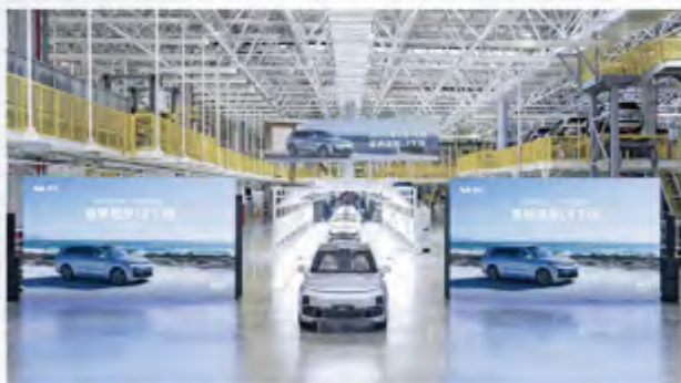
■ 首辆理想L9正式下线