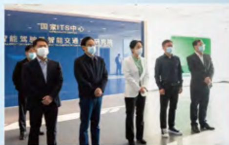
■ 调研国家智能商用车质量检验检测中心

心发展情况汇报，希望中心抢抓机遇，主动作为，充分发挥在智能驾驶、车路协同、检验检测等方面的平台优势，为常州市智能网联汽车产业链发展提供有力支撑。