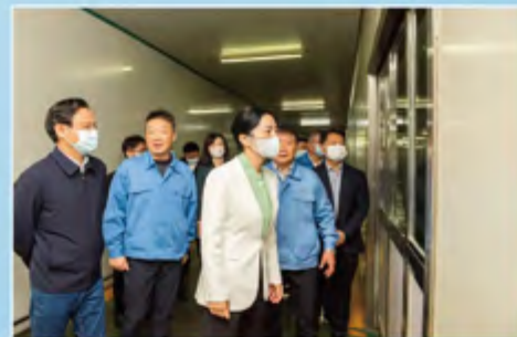
■ 调研常州星海电子股份有限公司

新、市场开拓情况，鼓励企业更好融入全市新能源产业体系，加强关键技术攻关，紧盯市场扩大产能，推动产品做精做优、企业做大做强，在行业竞争中争取更多话语权。