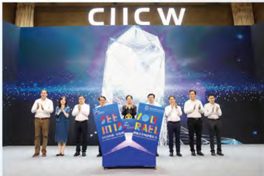
■ 中国—以色列创新合作周

他举例，森以创新中心是园区引进的第一批企业，由中以常州创新园、常州华森医疗器械有限公司、以色列趋势线集团三方合作，一期投入2000万元，已导入PMAA骨水泥、正合生物倒刺线、Btcp+胶原蛋白人工骨等多个项目。今年以来，华森借助森以创新中心，引进以色列先进技