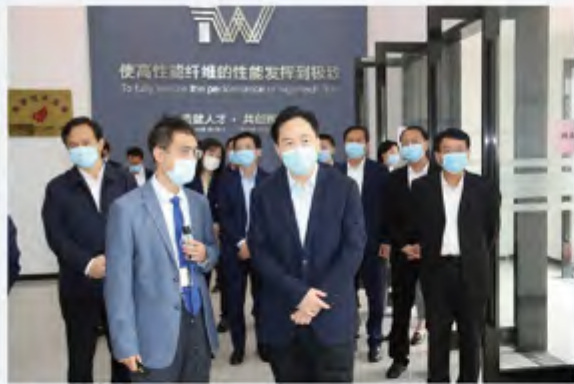
■ 调研江苏帝威新材料科技发展有限公司

创新创业的好时代。希望企业牢牢抓住重大机遇，沿着科技创新的大道坚定走下去。各板块各部门要充分运用常州产业基础扎实、创新氛围浓厚、人才政策最等优势，吸引更多领军型人才来常发展、创业，让更多创新的种子在常州这片热土上生根发芽，开花结果。