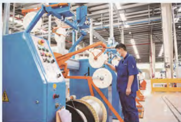
■ 莱尼电气线缆（中国）有限公司滨江工厂开业投产

在中德建交50周年之际，百年德企莱尼集团与常州的合作加快“升级”。9月16日，莱尼在常州高新区的第3家工厂在滨江经济开发区开业投产，标志着莱尼常州工厂瞄准新能源汽车产业进入全面市场化扩张期，成为常州新能源汽车产业又一股“新势力”。