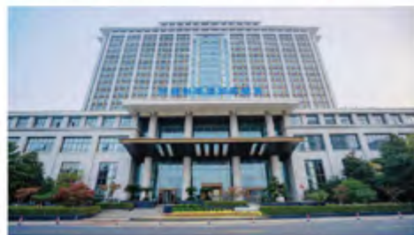
■ 智能制造龙城实验室

龙城实验室实行主任负责制和研究开发团队负责人负责制，对项目或团队负责人实施目标任务导向的管理机制，赋予项目或团队负责人的技术路径决策权、项目经费使用权和调剂权、人员聘用权与考核权；建立开放包容的科技成果转化制度，鼓励探索和创新，加快科技成果转化；实行面向市场实验室管理制度，充分激发高层次人才和创新团队的积极性。K