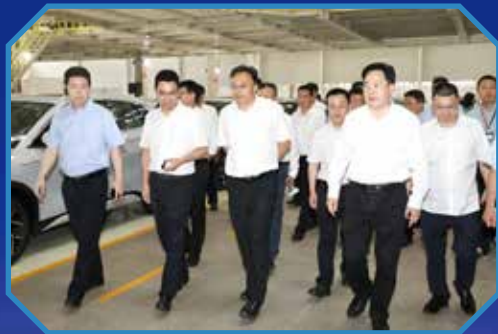
■ 调研常州比亚迪汽车有限公司