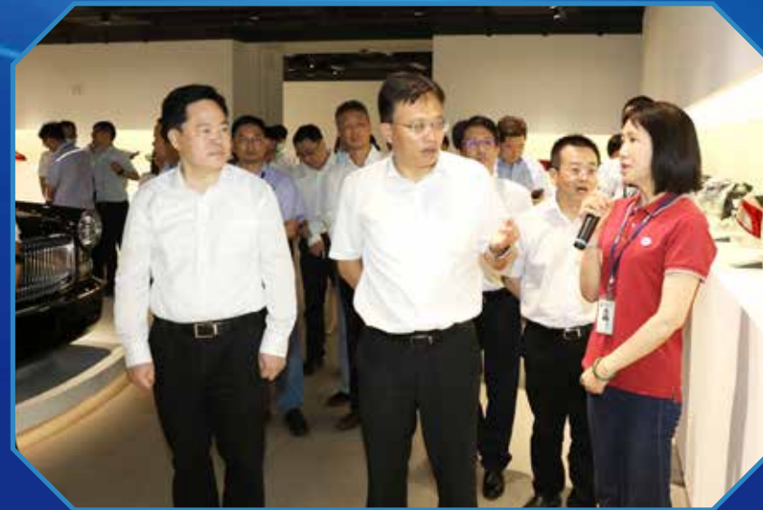
■ 调研常州星宇车灯股份有限公司

作为常州市重点发展的十大产业链之一，新能源汽车及其核心零部件产业近年来发展迅猛。胡广杰首先来到常州比亚迪汽车有限公司。目前，“常州制造”的元PLUS新能源汽车产量已突破4万台。到今年年底，常州比亚迪产能有望突破20万台。胡广杰进车间、看产品，详细了解企业生产经营、研发制造等情况，勉励企业积极顺应汽车市场行情变化，加大关键核心技术攻关力度，推动创新链、产业链、人才链深度融合。