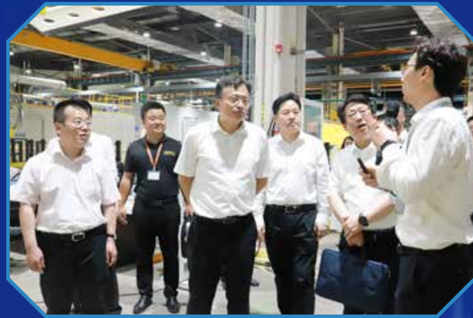
■ 调研常州启赋安泰复合材料科技有限公司