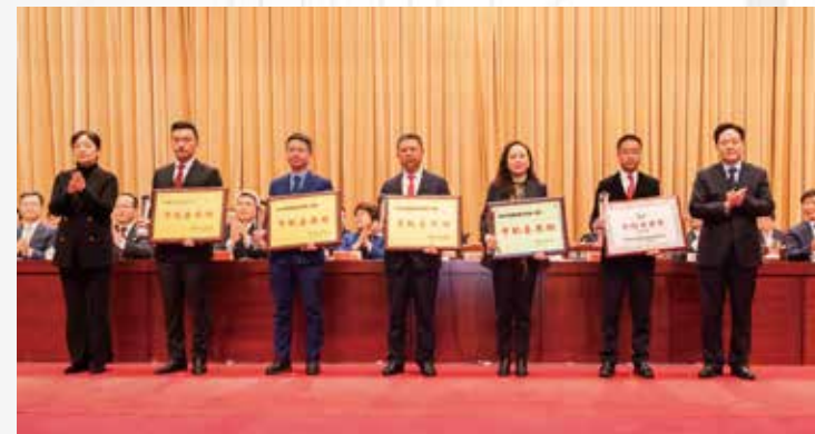
■ 颁发国家企业技术中心、国家技术发明奖市配套奖励和中国质量奖

当前，常州正在推动一场数字化革命，更是一场价值链革命。“工业+互联网”“工业+大数据”“工业+智能化”，这一个个“+”，都离不开“工业”这个本，都在催生一连串奇妙的“化学反应”。