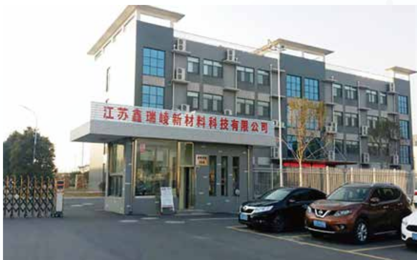
■ 江苏鑫瑞峻新材料科技有限公司

铜纯度达到99.99999%（7N）有多难？世界上掌握该项技术的国家不超过5家。