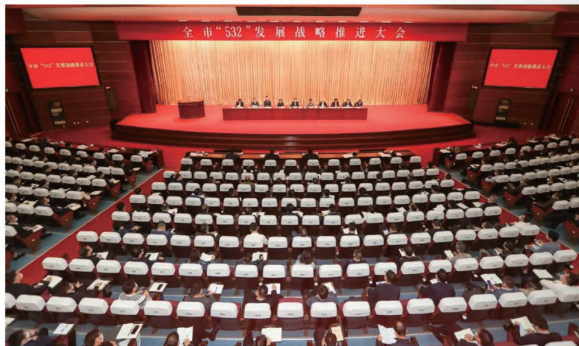
■ 全市“532”发展战略推进大会

我们将坚定不移贯彻落实国家创新驱动发展战略，推动高水平科技自立自强，全力打造长三角产业科技创新中心。一是种好创新“丰产田”。对标国际先进，高标准打造智能制造龙城实验室，瞄准数字化制造技术、智能制造与机器人技术、高端新材料等三大领域加强技术攻关，努