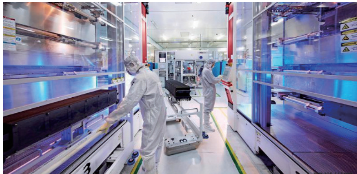
天合光能组件累计总出货量突破32GW

建成全国有影响力的太阳能光伏产业基地。 充分发挥新北、武进、金坛三个光伏产业集聚区的产业链优势，以天合光能、亿晶光电、顺风光电、东方日升等企业为龙头，瞄准国家“领跑者”计划中对高效率低成本太阳能电池的需求，着力研发高效太阳能电池用关键技术并推进其产业化建设，打造有全国影响力的太阳能光伏产业基地。