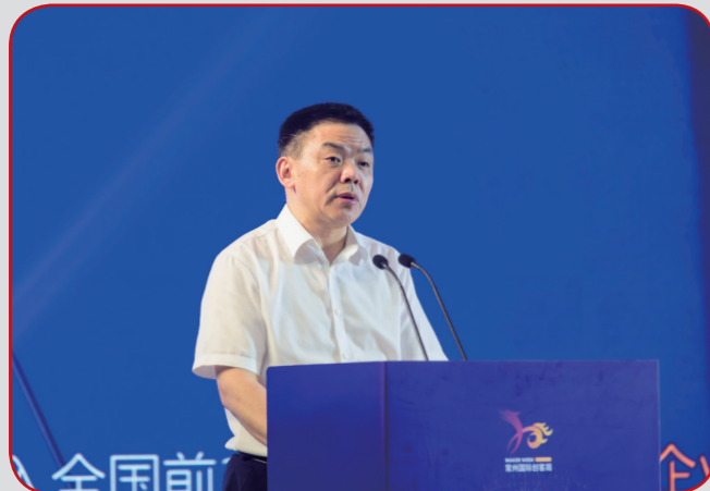
省科技厅副厅长过利平致辞