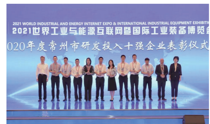
表彰2020年度常州市研发投入十强企业

在6月18日召开的工业与能源互联网博览会开幕式上，常州对2020年度研发投入十强企业进行表彰。瑞声光电、时代新能源、星宇车灯、蜂巢能源、柳工机械、东方日升新能源、恒立液压、华鹏变压器、新阳科技、格力博股份等10家企业累计研发投入超25亿元，瑞声光电以5.3亿元研发投入名列榜首。