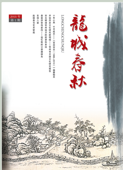
封面：清钱维城《苏轼舣舟亭》(局部)